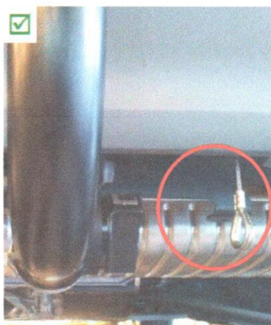
Sicht von hinten

- Stahlstrippe an der Traverse unter dem Stossfänger befestigt.