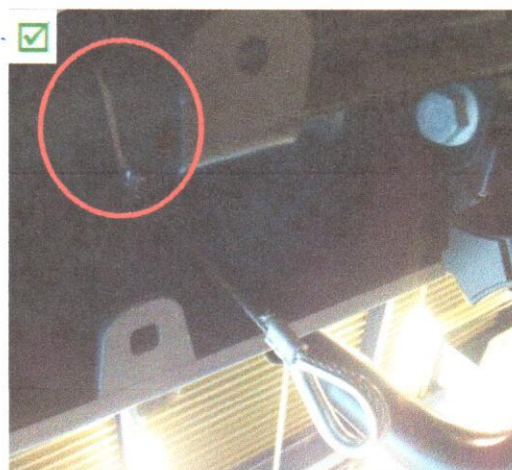
Sicht von unten auf Traverse

Das "Lasso mässige" Überwerfen ist nicht zulässig.